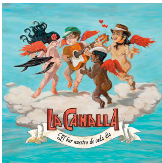
Art work: Santos de Veracruz

Con “ El bar nuestro de cada día ” La Canalla vuelve a demostrar que hay otra manera de hacer las cosas, que copla y jazz se llevan bien cuando tocan buenos músicos y se cuentan historias vivas , y que además son capaces de procesar con absoluta naturalidad otros ritmos tan dispares como el blues , la inspiración balcánica , el freejazz , la canción popular gallega o el mismísimo reguetton sin ningún tipo de complejos, con total honestidad y una buena dosis de provocación , siendo capaces de reírse sin dejar de llorar , una tragicomedia macerada en tinto y tabaco que llevan al escenario con un desconcierto cautivador creado a base de música y palabra .